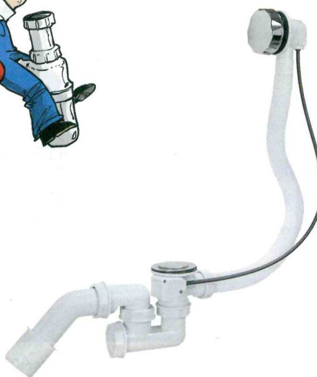
Odpływ wannowy automatyczny.

standardowo dołączanego do każdego odpływu. Odpływy brodzikowe Crudo dostępne są w wersji z pokry-